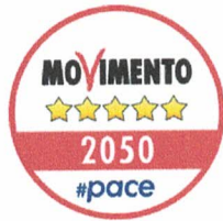
“Movimento 5 stelle”