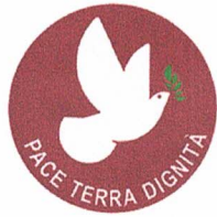
“Pace Terra Dignità”